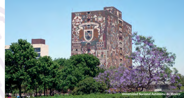
Universidad Nacional Autónoma de México