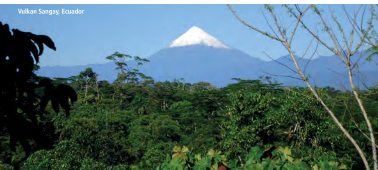
Vulkan Sangay, Ecuador